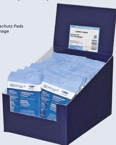
BWT bestsave Kalkschutz-Pads in attraktiver Kartonage